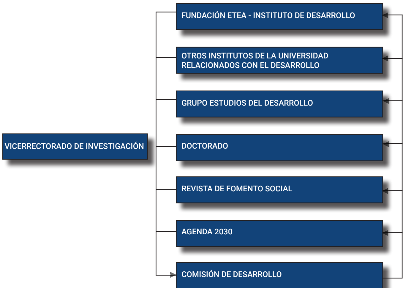
Figura 1. Estructura organizacional del trabajo en desarrollo en la universidad.

En la tarea de impulsar la reflexión y el trabajo en desarrollo y facilitar un contexto en el que todas las instancias y personas puedan ir avanzando progresivamente hacia una forma común de entender y trabajar en desarrollo en nuestra universidad, la Comisión de Desarrollo lleva a cabo su labor en el marco de la estructura organizativa de la universidad y en colaboración con la misma.